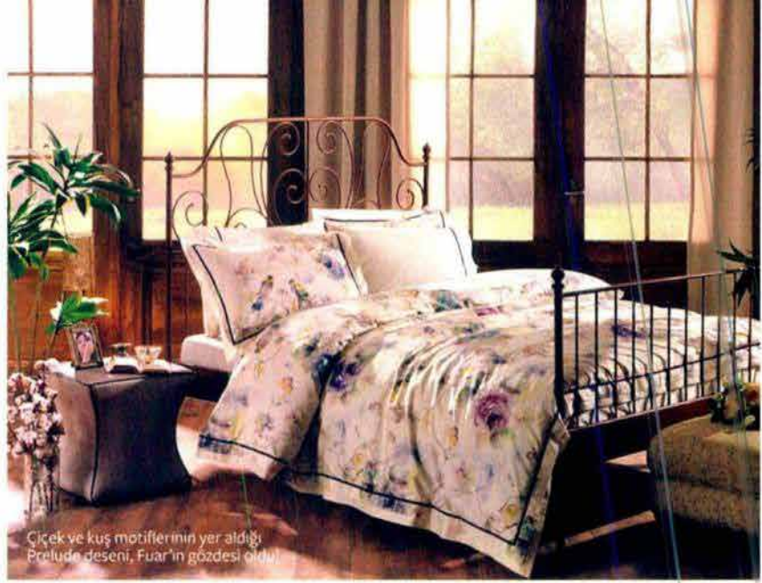
Çiçek ve kuş motiflerinin yer aldığı Prelude deseni, Fuar'ın gözdesi oldu!

2005 yılından bu yana şık ve zarif koleksiyonları, üstün kalite anlayışı ile ev tekstili sektöründe uluslararası markalardan biri haline gelen Zorlu Tekstil Grubu markalarından Valeron, 04-08 Eylül tarihlerinde gerçekleşen Maison&Objet Paris'te, yalın ve zarif detaylar içeren yeni koleksiyonunu ziyaretçilerle buluşturdu. Biz de fuarda yer alan şık standını gezdik ve yeni koleksiyonuna bayıldık! 2016 trendlerinden ilham alınarak tasarlanan yeni desenlerle yer alan Valeron; soft pastel tonlar ve narin küçük çiçeklerin hâkimiyetindeki romantik temalı konseptte sahip ürünleriyle dikkatimizi çekti. Gelenekselden kopmayan modern bir anlatıma sahip etnik şal desenli ürünlerinin yanı sıra, dantel ve jakarların bir arada kullanıldığı, beyazın farklı tonlarına sahip ürünleri de fuarı gezenler tarafından dikkatle incelendi. Başta Amerika ve Uzakdoğu olmak üzere Avrupa ve Ortadoğu da dahil 40'a yakın ülkede 200'ü aşkın noktada piyasaya sunulan Valeron ürünlerini daha yakından görmek ve özgün stilini evinize taşımak için Valeron Nişantaşı ve Valeron Zorlu Center mağazalarına mutlaka uğrayın! valeron.com.tr