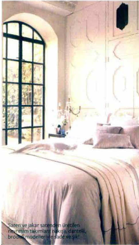
Saten ve jakar satenden üretilen nevresim takımları, paskisi, dantelli, brodaj modelleriyle sade ve şık!