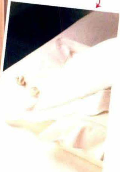
İncelikli detaylar, Valeron kalitesini yansıtıyor!