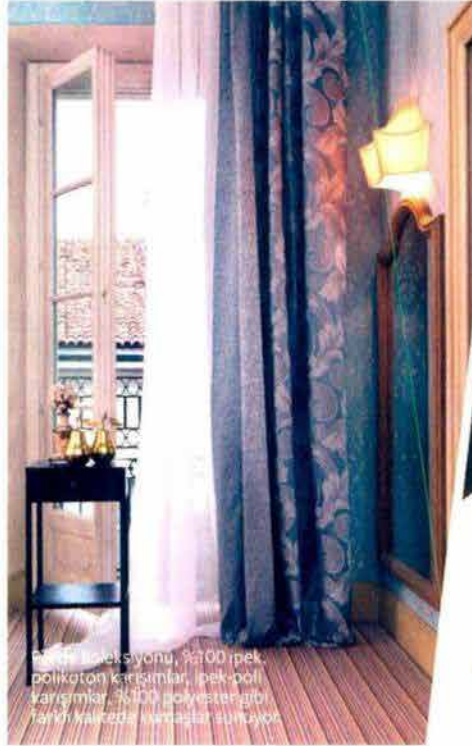
Yeni koleksiyonu, 1000 rpek, polikoton karışımlar, pek-poli karışımlar, 1000 polyester gibi farklı kalitede alternatif sunuyor.