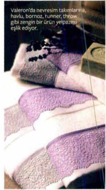
Valeron'da nevresim takımlarına, havlu, bornoz, runner, throw gibi zengin bir ürün yelpazesi eşlik ediyor.