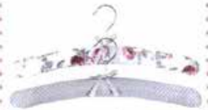
Elbise askısı: 69,90 TL, Uyku gözlüğü: 29,90 TL, Laura Ashley.