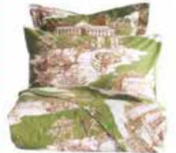
Nevresim takımı: 219,95 TL, Zara Home.