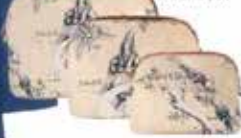
Çanta seti, Haremlique.