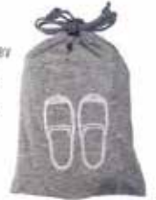
Jersey ev terliği: 39 TL, Muji.