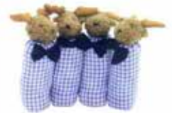
Dekoratif aksesuar, Tepe Home.