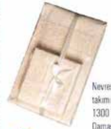
Nevresim takımı: 1300 TL, Damask.