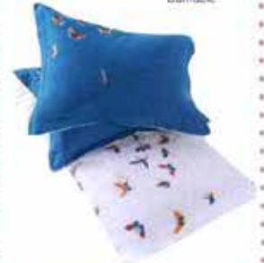
Nevresim takımı: 399,90 TL, Home Sweet Home.