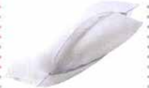
Çift taraflı yastık, Penelope.