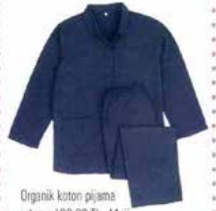
Organik koton pijama takımı: 139,90 TL, Muji.