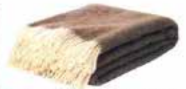
Alpaka yün battaniye: 159,90 TL, Muji.