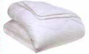
Yorgan: 570 TL, Habitat.